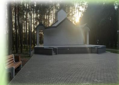
Сцена для выступлений