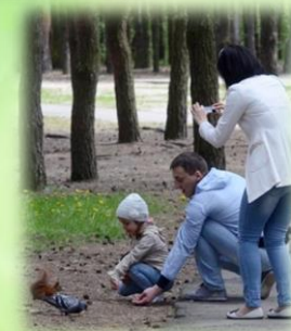
Белки-одна из достопримечательностей парка