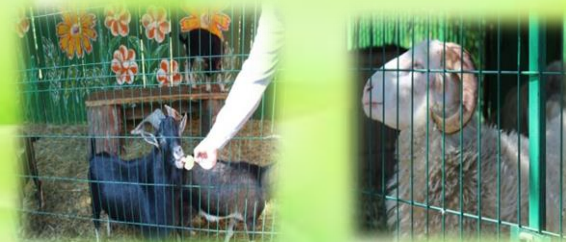
Уголок живой природы